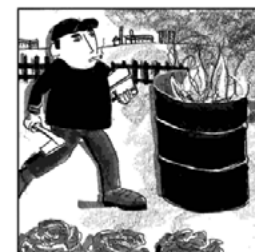
Durch das Verbrennen von bemaltem Holz werden Schwermetalle und andere Schadstoffe freigesetzt, die in den Boden und somit auch in die Pflanzen gelangen.