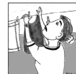
Ein grösseres Mottfeuer produziert in 6 Stunden so viel Russ und Rauchpartikel wie 250 Autobusse während eines ganzen Tages.