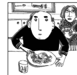
Guten Appetit beim nächsten Kopfsalat!