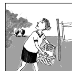
Der Rauch des Mottfeuers enthält gesundheitsschädliche Russpartikel und nebelt das ganze Tal ein.