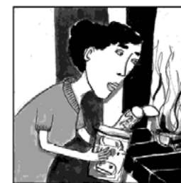
..... und verbrennt Haushaltabfälle in ihrem Cheminée.