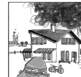
So wird bis zu 1000 Mal mehr Dioxin freigesetzt als in einer Kehrlichtverbrennungsanlage.