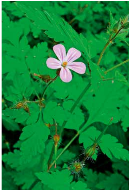
Ruprechtskraut (stinkender Storchenschnabel)

Spitzwegerich ist ein weit verbreitetes Pflänzchen; man findet es auf jeder Wiese. Spitzwegerich wirkt als pflanzliches Antibiotikum und hilft damit auch bei Infekten im Verdauungstrakt. Dabei schont es die wichtigen Darmbakterien, die dem Kaninchen beim Verdauen helfen. Spitzwegerich stärkt darüber hinaus die Atemwege und regt den Appetit an.