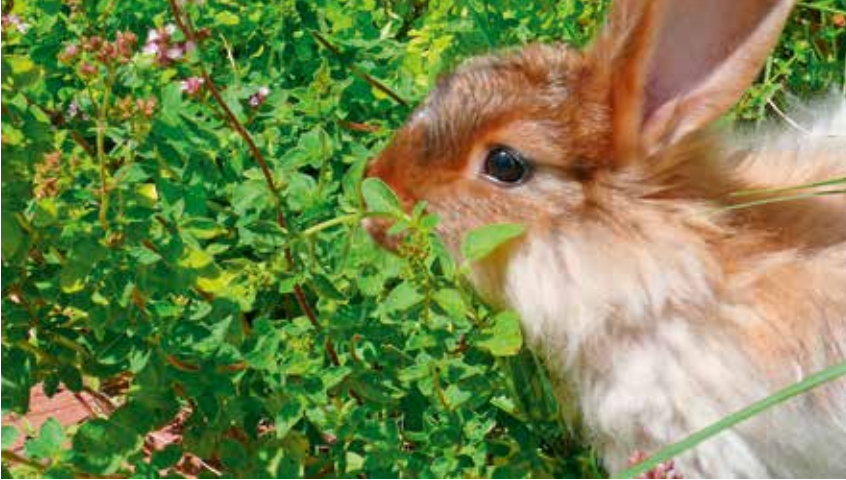
Dost (wilder Oregano)

Ein unterschätztes Pflänzchen ist das Ruprechtskraut oder Stinkender Storchenschnabel ( Geranium robertianum ), das bereits von den Kelten als Heilpflanze verwendet wurde. Seine schön gefiederten Blätter und die Blüte machen es eigentlich unverwechselbar. Dazu kommen die Früchte, deren Form zum Namen Storchenschnabel ver-